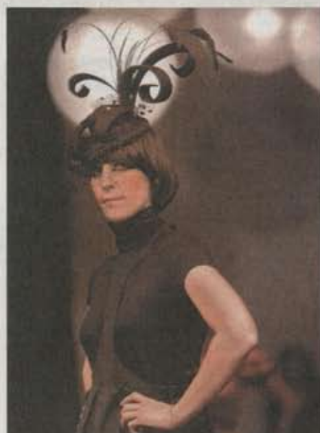
Selbstgenähtes mit Federn, Pomp und vielen Gegensätzen: die Abschlussklasse der Kerschensteinerschule zeigte gestern Abend in Feuerbach ihre Kollektionen.